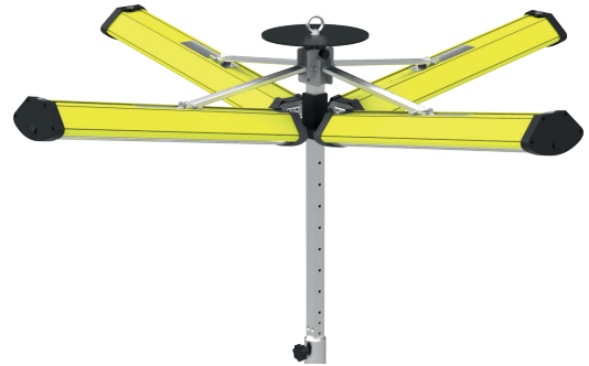
ALDEBARAN® 360 GRAD FLEX-C LED 600 COMPACT - 2.0