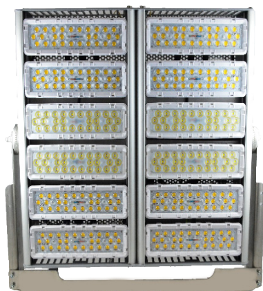
Vorderseite | AC2000 LED H40